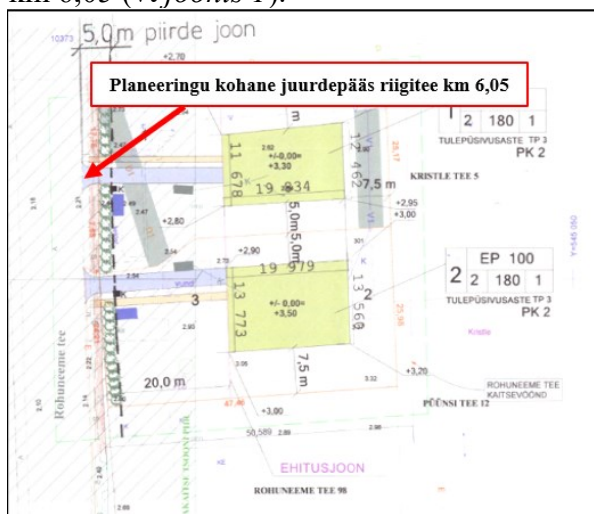
Joonis 1. Väljavõtte planeeringu põhijoonisest