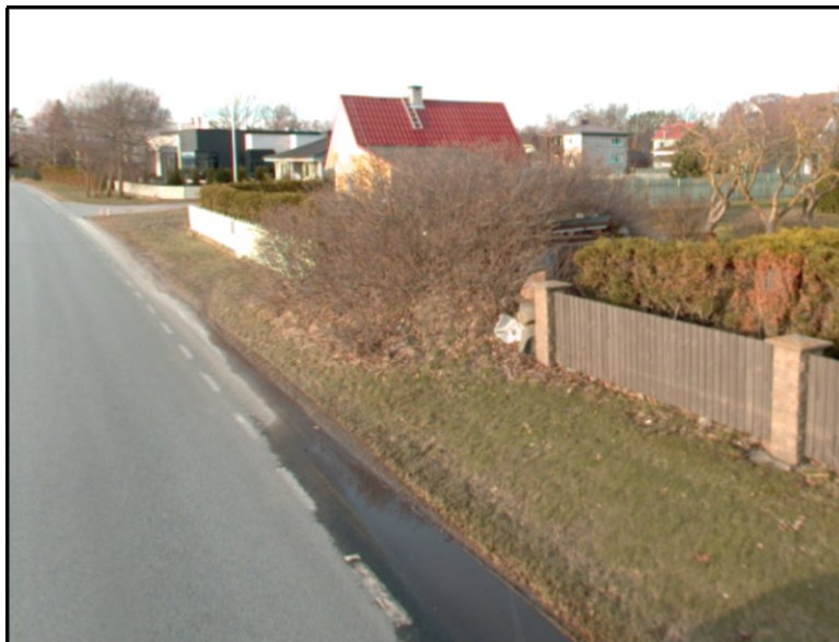
Joonis 3. Väljavõte teevideost (aprill 2024)