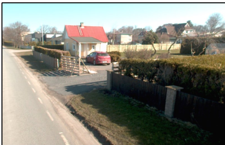
Joonis 4. Väljavõte teevideost (aprill 2025)

EhS § 8 järgi peab ehitise, ehitamine ja ehitise kasutamine ning ehitamisega seonduv muu tegevus olema ohutu. Ristumiskoha ehitamine on otseselt vajalik ehitusloa elluviimiseks, sh ka ehitamise ajal transpordi ohutuks juurdepääsuks riigiteedelt ehitusalale.