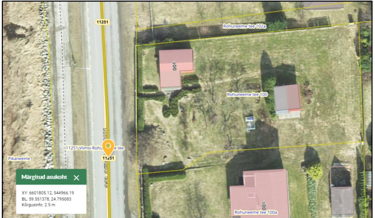
Joonis 1. Ristumiskoha asukoht tähistatud oranži tingmärgiga